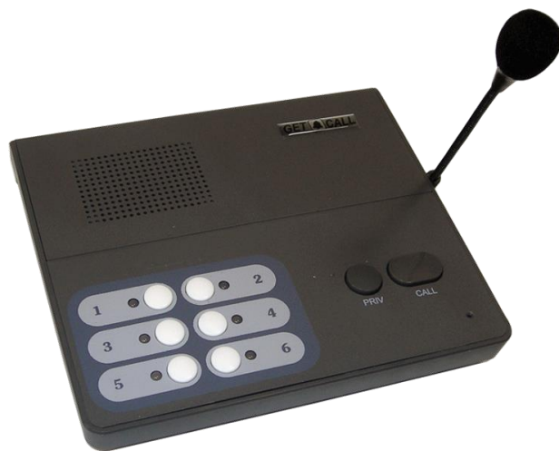
Рисунок 1. Внешний вид пульта GC-1006DG

Пульт GC-1006DG (рис.1) имеет пластмассовый корпус темно-серого цвета. На верхней поверхности пульта находятся кнопки выбора абонента, кнопка режима работы «PRIV», кнопка подачи общего вызова/сброса «CALL», решетка громкоговорителя, отверстие микрофона, светодиодные индикаторы абонентов. На задней боковой панели пульта имеется круглый разъем для подключения питания. На правой боковой стороне пульта расположены регуляторы громкости вызова и громкости динамика и разъем для подключения внешнего микрофона. В данный разъем устанавливается микрофон на гибкой стойке длиной 17 см.