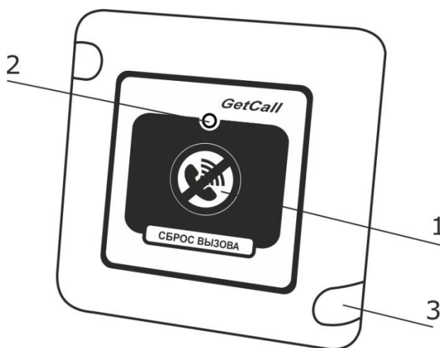
Рисунок 1. Внешний вид кнопки сброса вызова GC-0421W1

На рис.1 приведен внешний вид кнопки сброса вызова.